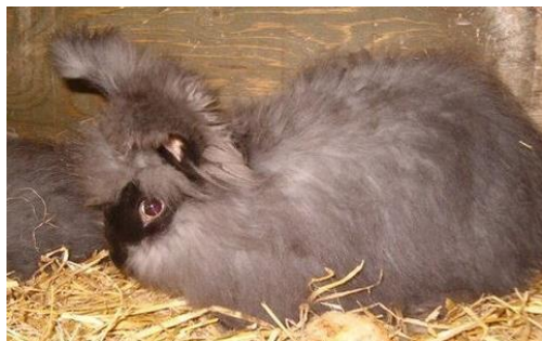
Angora med fuld pelslængde